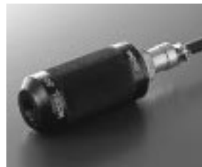
動電型検出器 / Model-2007