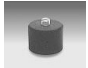
検出器取付用マグネット / MG-2