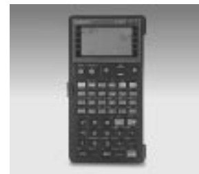
バランス修正用計算機

※本カタログに記載の仕様およびデザインは、製品改良のため予告なく変更する場合がありますので予めご了承ください。