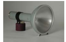
ストロボスコープ