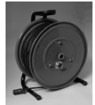
延長用検出器ケーブル